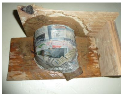
2 Holzform mit mehrlagigem durchnässtem Zeitungspapier abdecken.