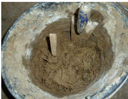
4 vorbereitete Lehmmischung