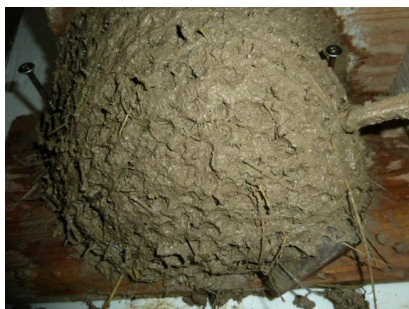
8 fertiges Nest mit Befestigungsschrauben