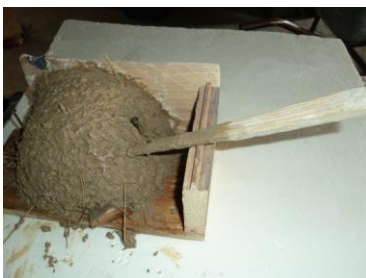
7 durch ringförmiges abtupfen wird die Oberflächenstruktur imitiert