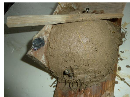
6 mit Holzspan eingeglättetes Nest