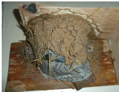
5 Kaninchendr. als Armierung in Lehmschicht einarbeiten.