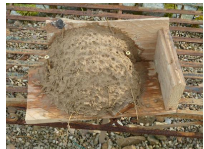
9 ab zur Lufttrocknung in die Sonne