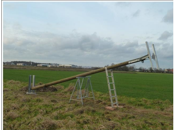
Baustand Storchenhorst 05.02.2022