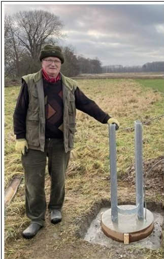
Baustand am 12.01.22