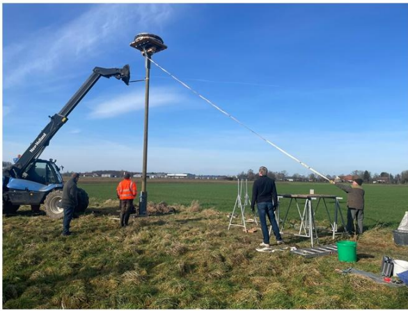
...gutes Augenmaß bei der Aufrichtung...