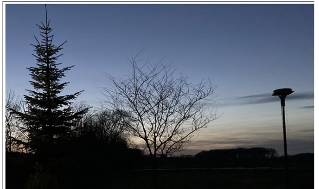
Storchenhorst am Abendhimmel 12.02.2022