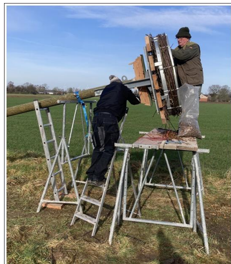
letzte Arbeiten in Bodennähe am Storchennest und MS Doppelkasten