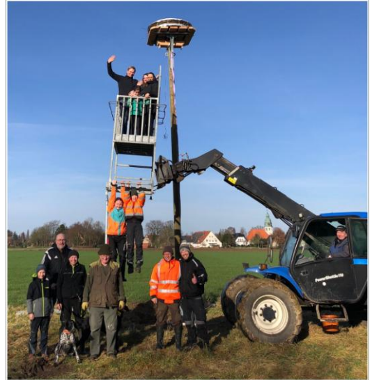
Der Storchenhorst steht...12.02.2022