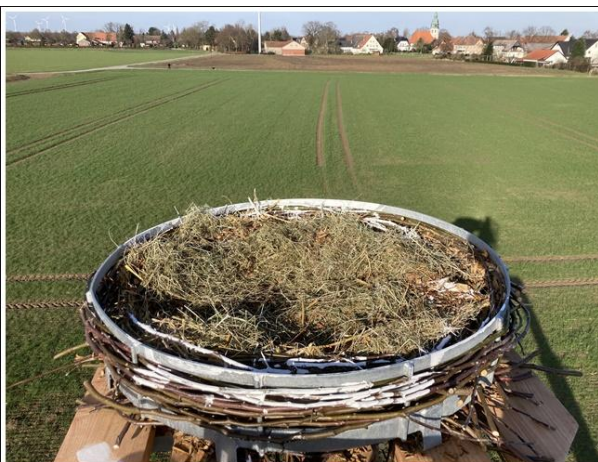
Fertiges Nest im Storchenblick auf Rabber