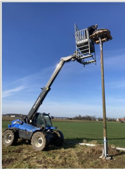
nach der Aufstellung letzte Arbeiten am Nest