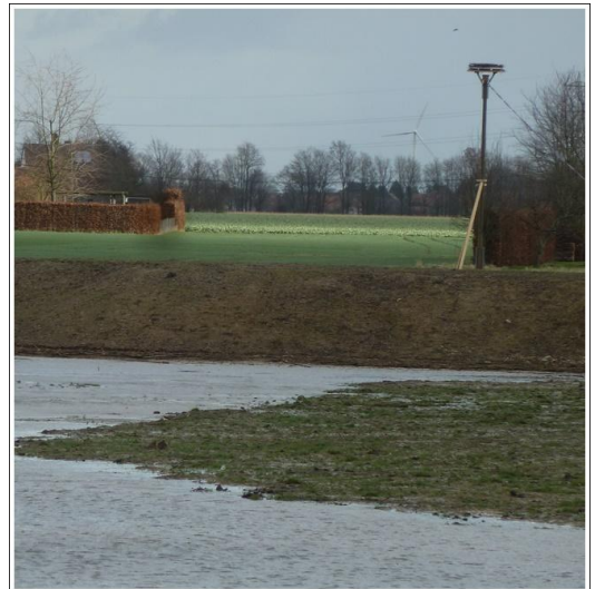
..im Vordergrund das 2021 neu erschaffene Biotop