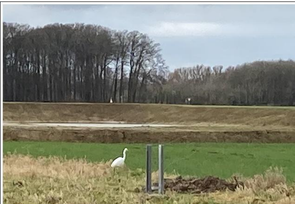
...der erste "Storch" war schon da und hat die Baustelle inspiziert.... und für gut befunden !!!!