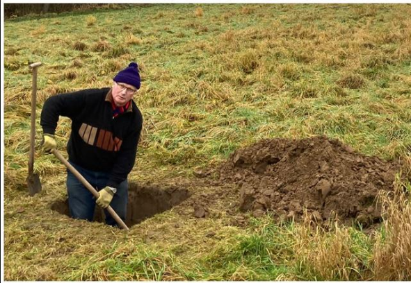
Startschuss mit Aushubarbeiten